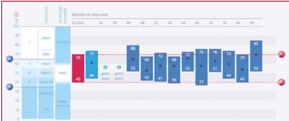
Figuur 1 Het schooloverzicht

Van zinloze administratie naar een betekenisvolle afspraak. Behapbaar, betekenisvol, minder administratie, meer samenwerken, we moeten opbrengstgericht passend onderwijs geven.